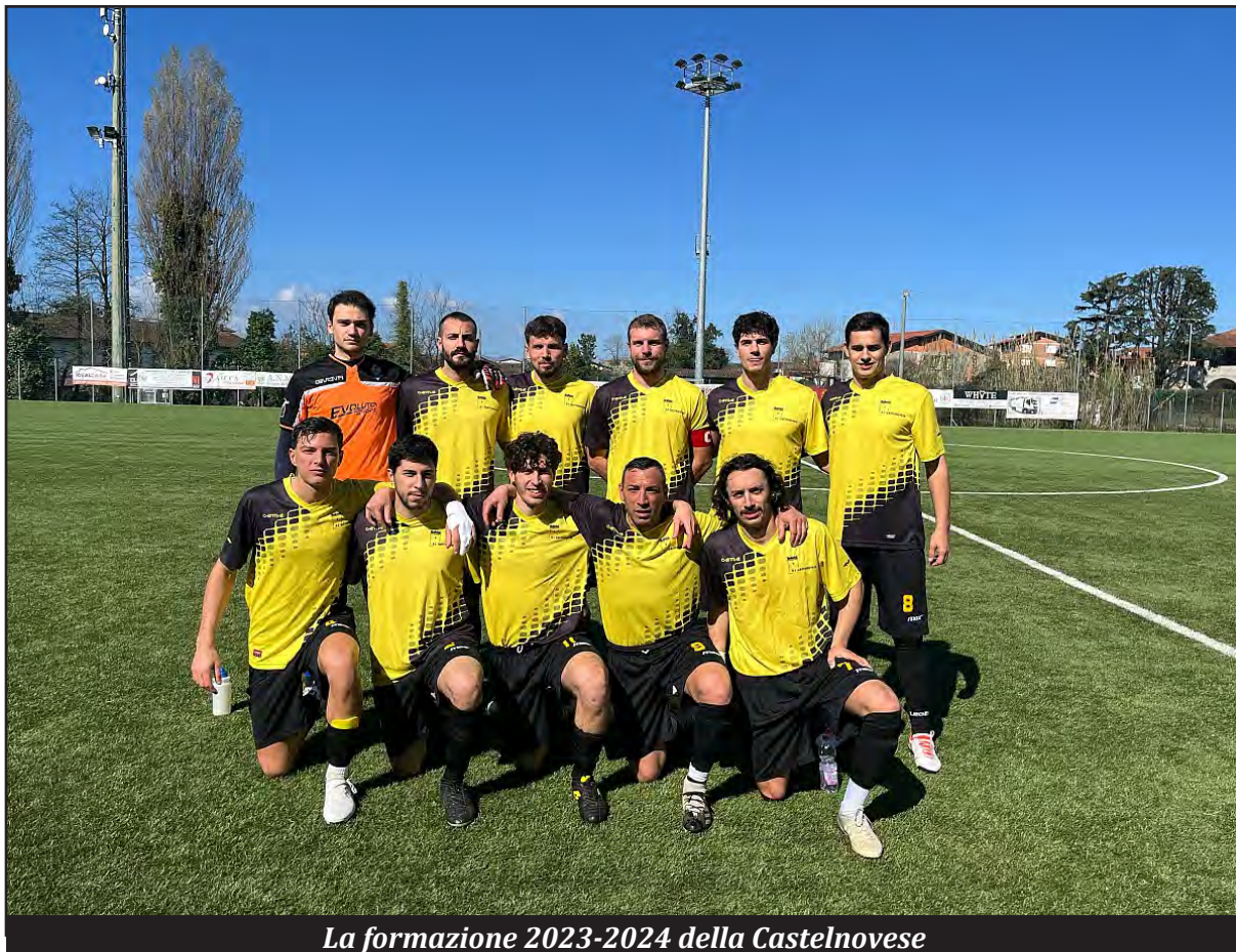
La formazione 2023-2024 della Castelnovese

con una giornata di anticipo. Un trionfo che arriva al termine di un campionato equilibrato e combattuto: basti pensare che il Follo ha subito 6 sconfitte in stagione, il doppio rispetto a quelle rimediale dall'Intercomunale Beverino nella stagione scorsa. Per quanto riguarda la prima posizione, i 52 punti del Follo rappresentano il punteggio più basso di tutta la Prima Categoria ligure (nel girone A il Millesimo ha vinto da imbattuto con 70 punti). Nella finale play-off si sfideranno Marolacquesanta e Brugnato che in semifinale hanno superato rispettivamente Segesta Sestri Levante (0-0, ma miglior piazzamento in campionato) e Bolanese (4-1). Tutto già definito in coda. Oltre al Vezzano, già matematica-